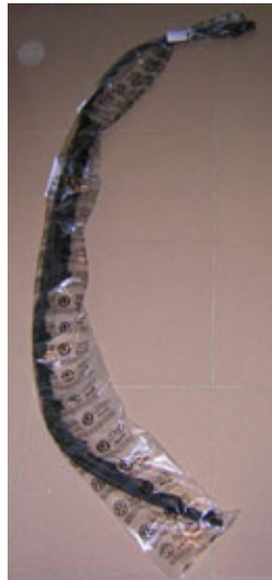
1ML 805 903