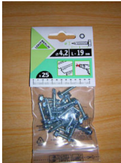
Tornillos rosca chapa hexagonales